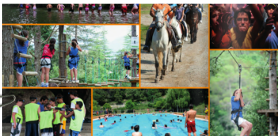
Activitats d'aventura, esportives i de lleure