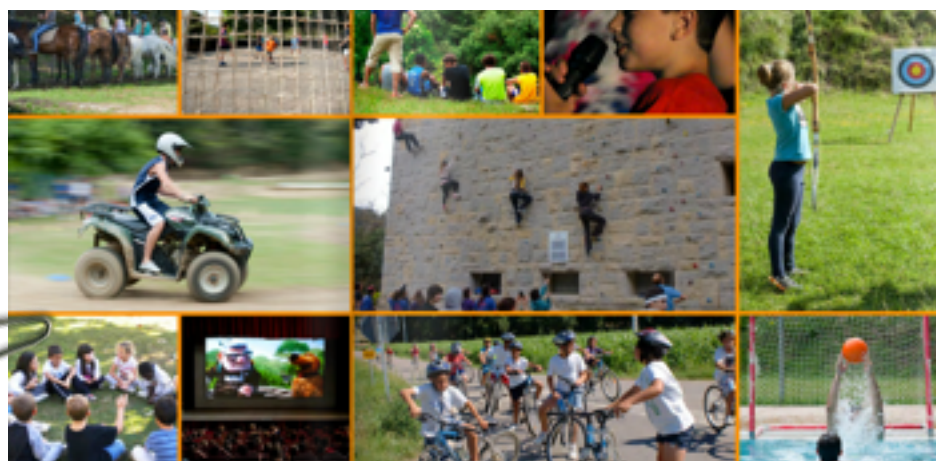
Activitats d'aventura, esportives i de lleure